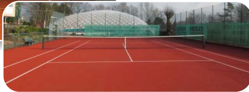
Tennis Force® ES