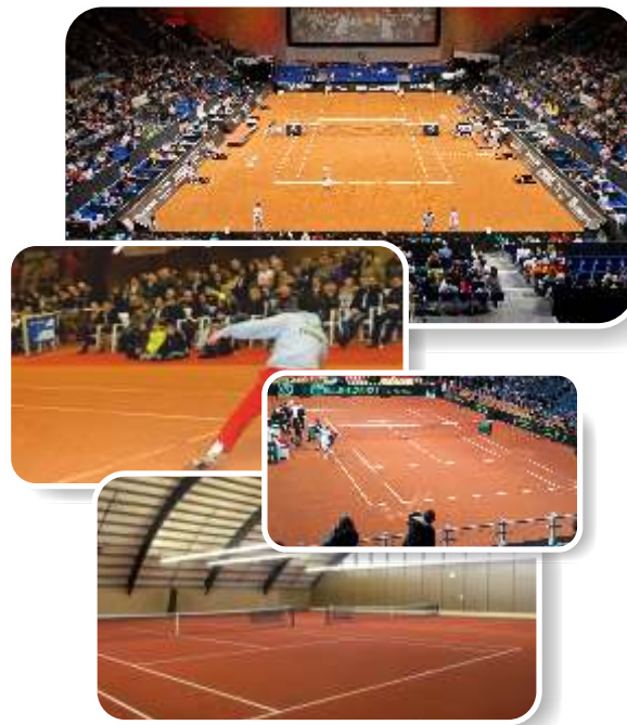
Tennis Force® HS Indoor (Hydroslide-Ziegelmehl)