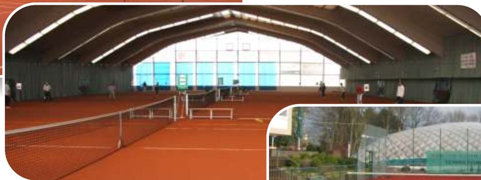
Tennis Force® HS