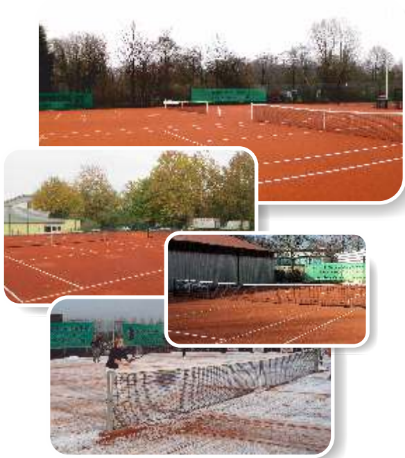
Tennis Force® Outdoor