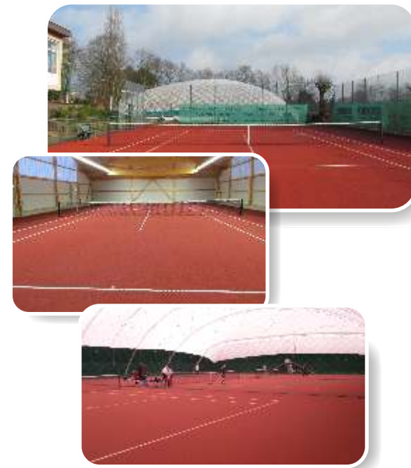
Tennis Force® ES Indoor/Outdoor (Elastic Slide)